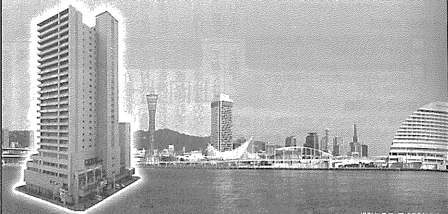
撮影年月日：平成23年3月