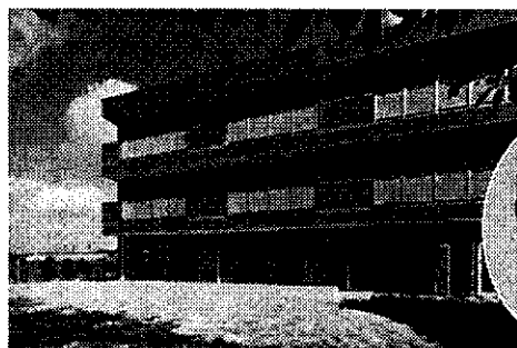
ここち西船橋と清宮ホーム長

我々の社会は、すでに「国民総介護時代」に突入している。 二〇一二年十月一日時点で、七十五歳以上人口（後期高齢者）は千五百十九万人いるが、団塊世代（一九四七年～一九四九年生まれ）が後期高齢者となる二〇二五年には約二千二百万人まで増加する。 老いた親や連れ合いを「どこで、どのように」介護するか。「終の棲家選び」は避けて通れない大きなテーマだ。正しく施設の「実力」を見極め、自分の希望