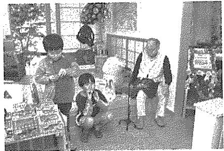
銀木屋にある駄菓子屋の様子

環境とサービスが提供される可能性は高まるが、必ずしも安い施設のすべてがお粗末なわけではなく、その逆もまた然り 価格帯から高めのものまで5段階に分けた。入居一時金のある施設については5年入居した場合の月額に換算し、価格が一目瞭然になるようにした。対象としたのはサ高住と有料老人ホーム(介護付き・住宅型)。入居難易度の高い特別養護老人ホームなどは扱わない。